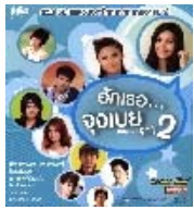
MP3 รักเธอ...จนเมย์ ชุดที่ 2 รหัสปก CD G0257095 วันที่วาง 07/08/2557