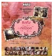
MP3 คิดถึงวันละนิดคิดขอดวันละหน่อย 2 รหัสปก CD G0257088 วันที่วาง 28/08/2557