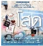
MP3 โสด รหัสปก CD G0257101 วันที่วาง 28/08/2557